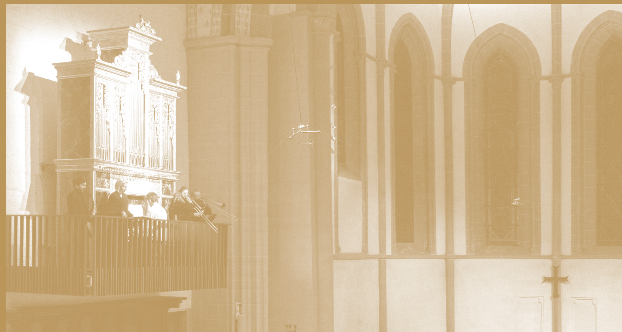
Graphisme: Plates-Bandes communication

Suivez nos actualités, projets et diffusions sur les réseaux: @organopole sur Instagram, Facebook et YouTube!