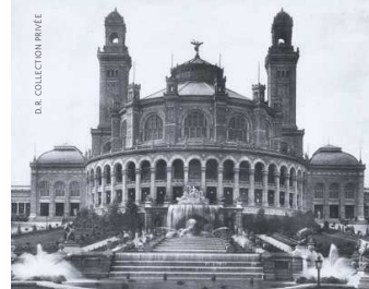
Paris. Le Palais du Trocadero.

En quittant Boulogne-sur-Mer, sa ville natale, en 1871, pour aller tenir le grand orgue de la Trinité à Paris 1 , Alexandre Guilmant 2 pouvait-il se douter de l'extraordinaire développement qu'allait connaître sa carrière artistique ?